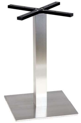
PCH-19-45 Hauteur 72cm min-max top = 60 à 80cm