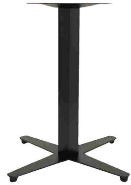
PZN-46 Hauteur 72cm min-max top = 50 à 60cm