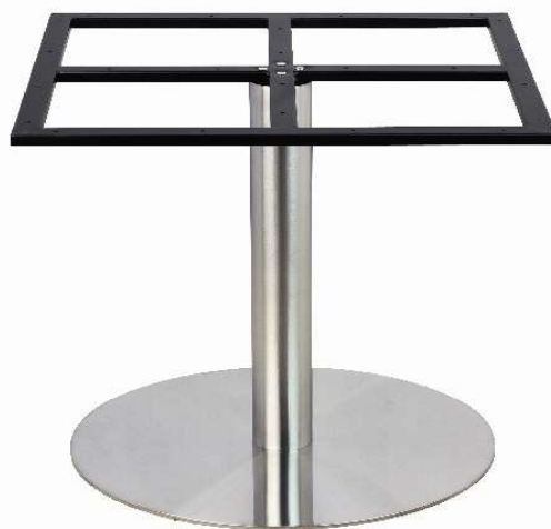
PCH-18-72 Hauteur 72cm min-max top = 110 à 140cm