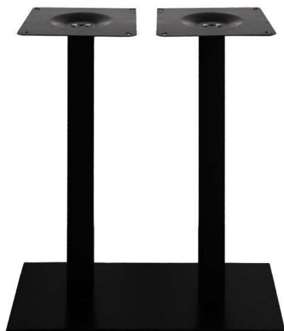
PZN-2627 Hauteur 108cm min-max top = 100x60 à 120x70cm