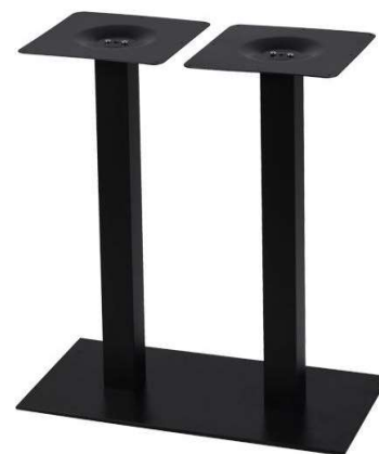
PZN-527 Hauteur 72cm min-max top = 100x60 à 120x70cm