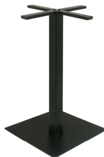
PZN-221 Hauteur 108cm min-max top = 60 à 80cm