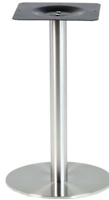
PCH-18-43 Hauteur 72cm min-max top = 50 à 60cm