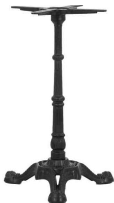
PZN-39* / PZN-39L PZN-39S / PZN-39F**

Hauteur 72cm min-max top = 100x60 à 120x80cm