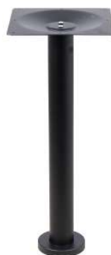
PZN-EL150 à fixer Hauteur 72cm min-max top = 50 à 80cm