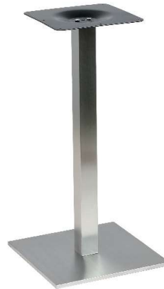
PCH-19-40 Hauteur 72cm min-max top = 50 à 60x70cm