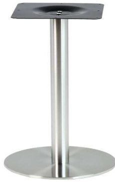
PCH-16-43 Hauteur 62cm min-max top = 50 à 60cm