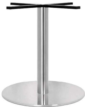
PCH-18-58 Hauteur 72cm min-max top = 90 à 110cm