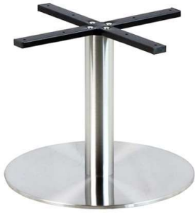
PCH-18-H48-50 Hauteur 48cm min-max top = 60 à 80cm