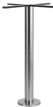
PCH-EL150* a fixer

Hauteur 72 à 108cm min-max top = 60 à 70cm