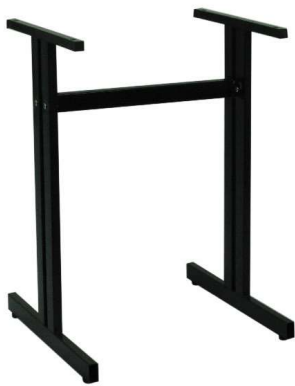
PZN-TT22 Hauteur 72cm min-max top = 60 à 80cm