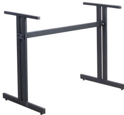
PZN-TT24 Hauteur 72cm min-max top = 100X60 à 120x80cm