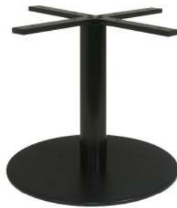
PZN-20-H48-43 (1) / PZN-20-H48-50 (2)

Hauteur 48cm (1) min-max top = 50 à 70cm (2) min-max top = 60 à 90cm