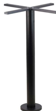
PZN-EL200 à fixer Hauteur 108cm min-max top = 60 à 80cm