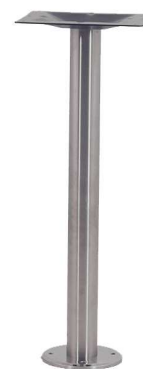
PCH-DL200 à fixer