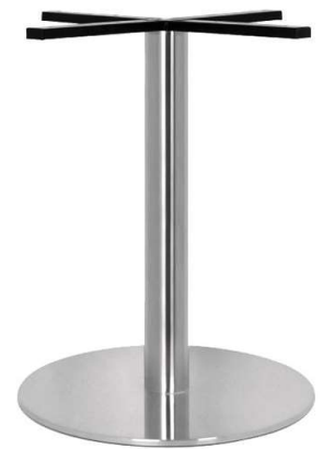
PCH-18-50 Hauteur 72cm min-max top = 60 à 80cm