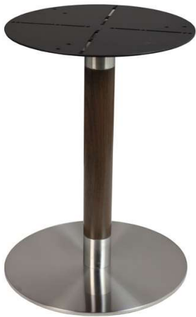
PCH-18-50WG Hauteur 72cm min-max top = 60 à 80cm