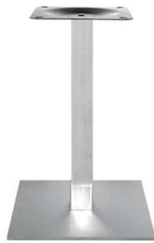
PCH-19-H62-40 Hauteur 62cm min-max top = 50 à 60x70cm