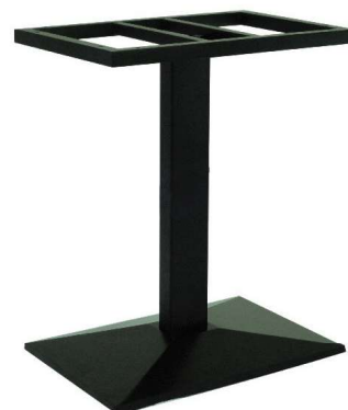
PZN-421 (1) / PZN-423 (2)

Hauteur 72cm (1) min-max top = 100x60 à 110x70cm (2) min-max top = 110x60 à 120x80cm