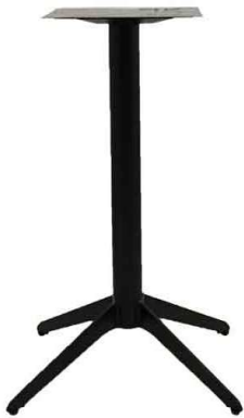
PZN-47 / PC0-C47 *