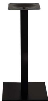
PZN-21-H62-40 Hauteur 62cm min-max top = 50 à 60x70cm