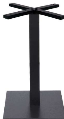
PZN-21-45 Hauteur 72cm min-max top = 60 à 80cm

** Existe aussi en blanc ref PZN-21-40-BL