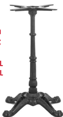
PZN-49* / PZN-49L PZN-49S / PZN-49F**

3 br. ref PZN-39L-BL 4 br. ref PZN-49L-BL