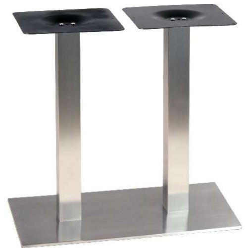
PCH-419 Hauteur 72cm min-max top = 100x60 à 120x70cm