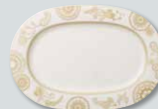
OCR-Nr. 10-4382-2940 Oval platter · Plat ovale · Platte oval Fuente ovalada · Piatto ovale 410 mm · 16 ¼ in