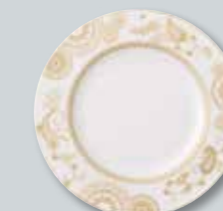
OCR-Nr. 10-4382-2630 Flat plate · Assiette plate · Teller flach · Plato llano · Piatto piano Ø 270 mm · 10 ½ in.