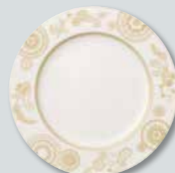
OCR-Nr. 10-4382-2810 Round platter · Plat rond · Platte rund · Fuente redonda · Piatto tondo Ø 330 mm · 13 in.