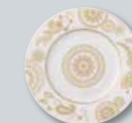
OCR-Nr. 10-4382-2650 Flat plate · Assiette plate · Teller flach · Plato llano · Piatto piano Ø 220 mm · 9 in.