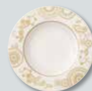
OCR-Nr. 10-4382-2700 Deep plate · Assiette creuse · Teller tief · Plato hondo · Piatto fondo Ø 240 mm · 9 ½ in.