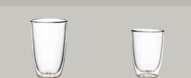
OCR-Nr. 16-4026-6000 Saucer - Soucoupe - Untertasse Plato taza - Piattino 160 mm · 6 ¼ in. (Tumbler, Gobelet, Becher, Vaso, Bicchiere OCR-Nr. 11-7243-2860, -2870, -2880, -2890 Cup, Tasse seule, Tasse, Tazza OCR-Nr. 11-7243-2830, -2840, -2820, -2810) OCR-Nr. 16-4026-0780 Creamer - Cremer - Giesser Lechera baja - Cremiera 0,20 l - 7 ozs. OCR-Nr. 16-4026-0800 Creamer - Cremer - Giesser Lechera baja - Cremiera 0,10 l - 3 ½ ozs.

Hotel porcelain, dishwasher-safe, microwave-safe, salamander-safe - Porcelaine d'hôtel, garantie lave-vaisselle, four micro-ondes, salamandre - Hotelporzellan, spülmaschinenfest, mikrowellensicher, salamanderfest - Porcelana de hostelería, garantizada al lavavajillas, horno microondas, salamandra - Porcellana per alberghi, inalterabile in lavastoviglie, adatta per microonde e salamandre