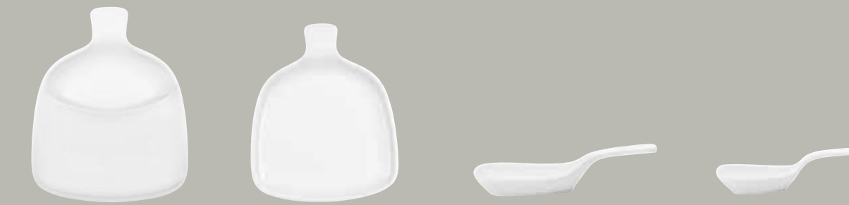
OCR-Nr. 16-4025-1172 Barbecue plate - Ass. a barbecue Grillteller - Plato barbecue Piatto barbecue 370 x 305 mm · 14 ½ x 12 in. OCR-Nr. 16-4025-1174 Sandwich plate - Assiette d. Sandwich - Sandwich Teller Piatto Sandwich - Piatto Sandwich 330 x 270 mm · 13 x 10 ½ in. OCR-Nr. 16-4025-1170 Antipasti bowl - Coup. antipasti Antipastischale - Cazoleta aperit. Copp. antipasti 240 x 135 mm · 9 ½ x 5 ¼ in. OCR-Nr. 16-4025-1171 Antipasti bowl - Coup. antipasti Antipastischale - Cazoleta aperit. Copp. antipasti 170 x 95 mm · 6 ¾ x 3 ¾ in.