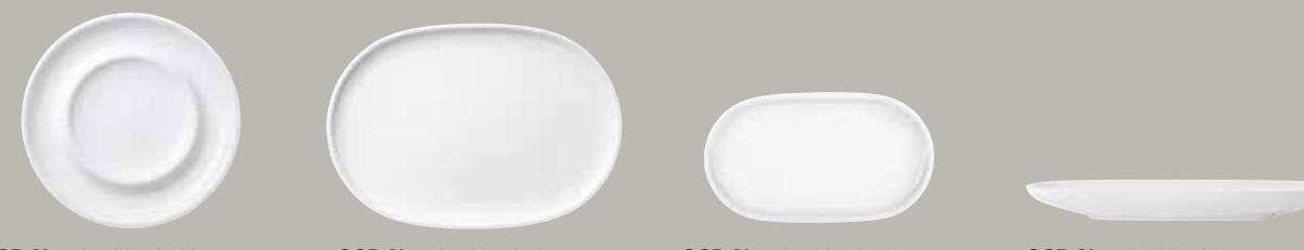
OCR-Nr. 16-4025-3760 Presentation bowl - Coupe presentation - Präsentationsschale Centro presentacion - Coppa presentazione 370 mm · 14 ½ in. OCR-Nr. 16-4025-2584 Oval platter - Coupe ovale Platte oval - Fuente ovalada Piatto ovale 430 x 300 mm · 16 ¾ x 11 ¾ in. OCR-Nr. 16-4025-3570 Oval platter - Plat ovale Platte oval - Fuente ovalada Piatto ovale 280 x 160 mm · 11 x 6 ¼ in. OCR-Nr. 16-4025-3844 Oval bowl - Coupe ovale Schale oval - Cazoleta ovalada Coppetta ovale 550 x 170 mm · 21 ½ x 6 ¾ in.