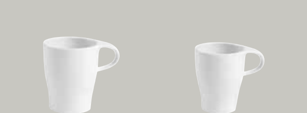
OCR-Nr. 16-4026-1240 Cup - Tasse seule - Tasse Taza - Tazza 0,35 l - 12 ozs. OCR-Nr. 16-4026-1270 Cup - Tasse seule - Tasse Taza - Tazza 0,26 l - 9 ozs. OCR-Nr. 16-4026-9651 Mug - Chope - Becher mit Henkel Jarra - Bicchiere c.manico 0,38 l - 12 ¾ ozs. OCR-Nr. 16-4026-1271 Cup - Tasse seule - Tasse Taza - Tazza 0,22 l - 7 ½ ozs.