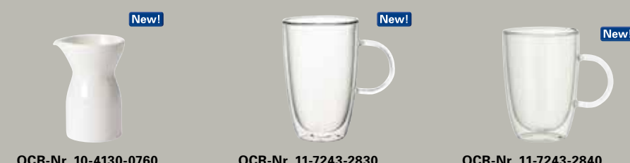
OCR-Nr. 16-4026-0780 Creamer - Cremer - Giesser Lechera baja - Cremiera 0,20 l - 7 ozs. OCR-Nr. 16-4026-0800 Creamer - Cremer - Giesser Lechera baja - Cremiera 0,10 l - 3 ½ ozs. OCR-Nr. 10-4130-0760 Creamer - Cremer Milchkaennchen - Lechera baja Cremiera 0,2 l - 7 ozs. OCR-Nr. 11-7243-2830 Cup XL - Tasse XL - Tasse XL Taza XL - Tazza XL 140 mm · 0,45 l · 5 ½ in. · 15 ¼ ozs. OCR-Nr. 11-7243-2840 Universal cup - Tasse universelle Tasse Universal - Tazza universale Taza universal 122 mm · 0,39 l · 4 ¾ in. · 13 ½ ozs.