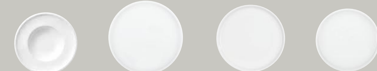
OCR-Nr. 16-4025-2700 Deep plate - Assiette creuse Teller tief - Plato hondo - Piatto fondo. 250 mm · 9 ¾ in. OCR-Nr. 16-4025-2590 Coupe flat plate - Assiette plate coupe - Coupeteller flach - Plato llano coupe - Piatto piano coupe 320 mm · 12 ½ in. OCR-Nr. 16-4025-2601 Coupe flat plate - Assiette plate coupe - Coupeteller flach - Plato llano coupe - Piatto piano coupe 290 mm · 11 ¼ in. OCR-Nr. 16-4025-2621 Coupe flat plate - Assiette plate coupe - Coupeteller flach - Plato llano coupe - Piatto piano coupe 270 mm · 10 ½ in.