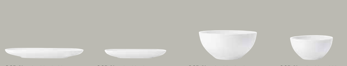
OCR-Nr. 16-4025-3580 Oval bowl - Coupe ovale Schale oval - Coppetta ovale Cazoleta ovalada 440 x 140 mm · 17 ½ x 5 ½ in. OCR-Nr. 16-4025-3577 Oval bowl - Coupe ovale Schale oval - Coppetta ovale Cazoleta ovalada 280 x 80 mm · 11 x 3 ¼ in. OCR-Nr. 16-4025-3170 Salad bowl - Saladier - Schüssel Ensaladera - Insalatiera 280 mm · 11 in. OCR-Nr. 16-4025-1900 Bowl - Bol - Bol - Tazón - Scodella 0,60l - 20 ¼ ozs.