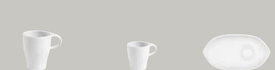
OCR-Nr. 16-4026-1360 Cup - Tasse seule - Tasse Taza - Tazza 0,18 l - 6 ozs. OCR-Nr. 16-4026-1450 Cup - Tasse seule - Tasse Taza - Tazza 0,09 l - 6 ¾ ozs. OCR-Nr. 16-4026-1520 Cafe gourmand plate Plato taza - Piattino 290 x 160 mm · 11 ¼ x 6 ¼ in. (Cup, Tasse seule, Tasse, Tazza OCR-Nr. 16-4026-1240, -1270, -1271, -1360, -1450) OCR-Nr. 16-4026-1280 Saucer - Soucoupe - Untertasse Plato taza - Piattino 170 mm · 6 ¾ in. (Cup, Tasse seule, Tasse, Tazza, Tazza OCR-Nr. 16-4026-1240, -1270, -1271, -1360, -9651)