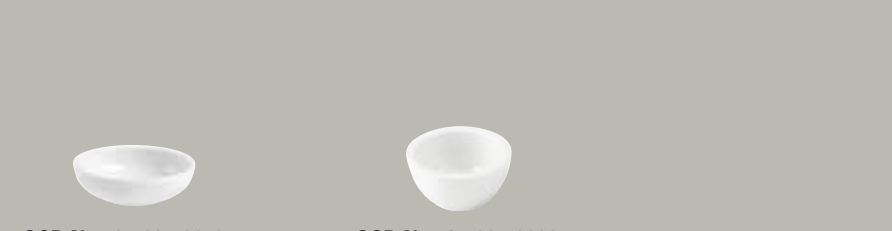
OCR-Nr. 16-4025-3810 Bowl - Vide poche - Schälchen Coppetta - Cazoleta 130 mm · 5 in. OCR-Nr. 16-4025-3932 Dip bowl - Coupelle Dip Dipschälchen - Cazoleta Dip Coppetta Dip 80 mm · 3 ¼ in.