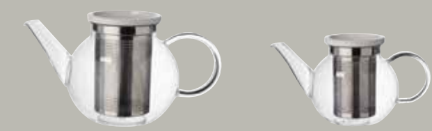
OCR-Nr. 11-7243-7276 Teapot M with strainer - Theiere M avec passoire - Teekanne M mit Sieb - Tetera M con colador Teiera M con colino 143 mm · 11 · 5 ¾ in. · 34 ozs. OCR-Nr. 11-7243-7270 Teapot S with strainer - Theiere S avec passoire - Teekanne S mit Sieb - Tetera S con colador Teiera S con colino 120 mm · 0,5 l · 4 ¾ in. · 17 ozs.