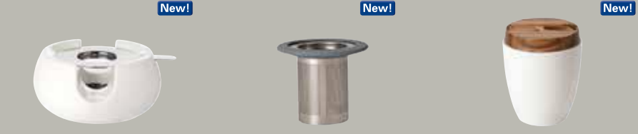
OCR-Nr. 11-7243-7290 Heater - Rechaud - Stoevchen Calentador - Scaldino Tefilter - Teekanne - Filtro del te Teedose m.Dkl. u.Loeffel (Teapot with strainer, Theiere avec passoire, Teekanne mit Sieb, Teiera con colador, Teiera con colino, OCR-Nr. 11-7243-7270, -7276) OCR-Nr. 10-4130-7960 Tea filter Teapot - Filtre thé Theière Tefilter Teekanne - Filtro del te Teedose m.Dkl. u.Loeffel Bote de te con ta. y Cucc. Sca di te c.coper.e Cucc. 0,85 l - 29 ozs. OCR-Nr. 10-4130-4570 Tea caddy w.cover a.spoon Boite a t.a.couvert Cu. Teedose m.Dkl. u.Loeffel Bote de te con ta. y Cucc. Sca di te c.coper.e Cucc. 0,85 l - 29 ozs.

Hotel porcelain, dishwasher-safe, microwave-safe, salamander-safe - Porcelaine d'hôtel, garantie lave-vaisselle, four micro-ondes, salamandre - Hotelporzellan, spülmaschinenfest, mikrowellensicher, salamanderfest - Porcelana de hostelería, garantizada al lavavajillas, horno microondas, salamandra - Porcellana per alberghi, inalterabile in lavastoviglie, adatta per microonde e salamandre