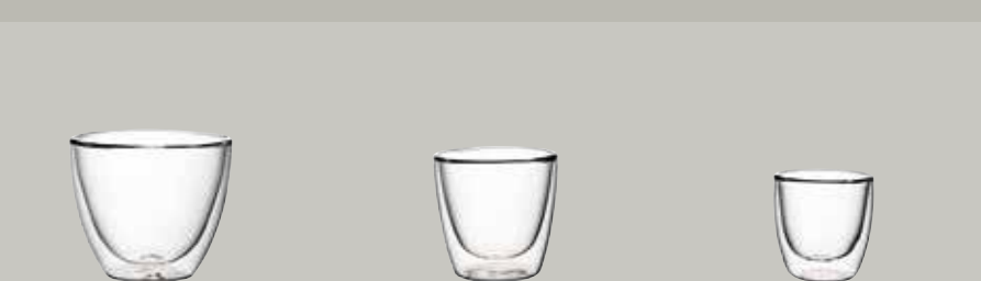
OCR-Nr. 11-7243-2860 Tumbler L - Gobelet L Becher L - Vaso L Bicchiere L 0,45 l · 15 ¼ ozs. OCR-Nr. 11-7243-2880 Cup S - Tasse S - Tasse S Taza S - Tazza S 68 mm · 0,11 l 2/2/3 in. · 3 3/4 ozs. OCR-Nr. 11-7243-2890 Universal tumbler - Gobelet universel - Becher Universal - Vaso universal - Bicchiere universale 0,39 l · 13 ½ ozs. OCR-Nr. 11-7243-2870 Tumbler L - Gobelet L Becher L - Vaso L Bicchiere L 0,42 l · 14 ¾ ozs. OCR-Nr. 11-7243-2860 Tumbler M - Gobelet M Becher M - Vaso M Bicchiere M 0,22 l · 7 ½ ozs. OCR-Nr. 10-4130-2850 Tumbler S - Gobelet S Becher S - Vaso S Bicchiere S 0,11 l · 3 ¾ ozs.

Hotel porcelain, dishwasher-safe, microwave-safe, salamander-safe - Porcelaine d'hôtel, garantie lave-vaisselle, four micro-ondes, salamandre - Hotelporzellan, spülmaschinenfest, mikrowellensicher, salamanderfest - Porcelana de hostelería, garantizada al lavavajillas, horno microondas, salamandra - Porcellana per alberghi, inalterabile in lavastoviglie, adatta per microonde e salamandre