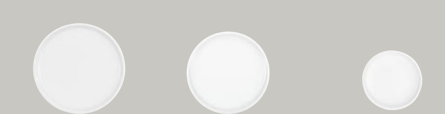
OCR-Nr. 16-4025-2631 Coupe flat plate - Assiette plate coupe - Coupeteller flach - Plato llano coupe - Piatto piano coupe 240 mm · 9 ½ in. OCR-Nr. 16-4025-2640 Coupe flat plate - Assiette plate coupe - Coupeteller flach - Plato llano coupe - Piatto piano coupe 220 mm · 8 ½ in. OCR-Nr. 16-4025-2660 Coupe flat plate - Assiette plate coupe - Coupeteller flach - Plato llano coupe - Piatto piano coupe 160 mm · 6 ¼ in.