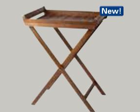
OCR-Nr. 10-4130-8064 Tray with stand - Plateau avec treteaux - Tablett mit Standfuß Bandeja con pie - Vassoio con supporto 57,3 x 40,5 x 73,5 cm

Hotel porcelain, dishwasher-safe, microwave-safe, salamander-safe - Porcelaine d'hôtel, garantie lave-vaisselle, four micro-ondes, salamandre - Hotelporzellan, spülmaschinenfest, mikrowellensicher, salamanderfest - Porcelana de hostelería, garantizada al lavavajillas, horno microondas, salamandra - Porcellana per alberghi, inalterabile in lavastoviglie, adatta per microonde e salamandre