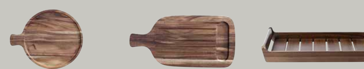
OCR-Nr. 10-4130-8058 Antipasti plate - Plat a antipasti - Antipasti-platte - Plato aperitivo - Piatto antipasti 280 mm · 11 in. OCR-Nr. 10-4130-8060 Chopping-/serving board - Plaque a decouper-/servir - Schneide-/Servierbrett Vassoio rettango. 573 x 405 x 85 mm · 22 ½ x 16 x 3 ¼ in. OCR-Nr. 10-4130-8065 Rectangular tray - Plateau rectang. Tablett rechteck. - Bandeja rectang. Vassoio rettango. 573 x 405 x 85 mm · 22 ½ x 16 x 3 ¼ in.

Hotel porcelain, dishwasher-safe, microwave-safe, salamander-safe - Porcelaine d'hôtel, garantie lave-vaisselle, four micro-ondes, salamandre - Hotelporzellan, spülmaschinenfest, mikrowellensicher, salamanderfest - Porcelana de hostelería, garantizada al lavavajillas, horno microondas, salamandra - Porcellana per alberghi, inalterabile in lavastoviglie, adatta per microonde e salamandre