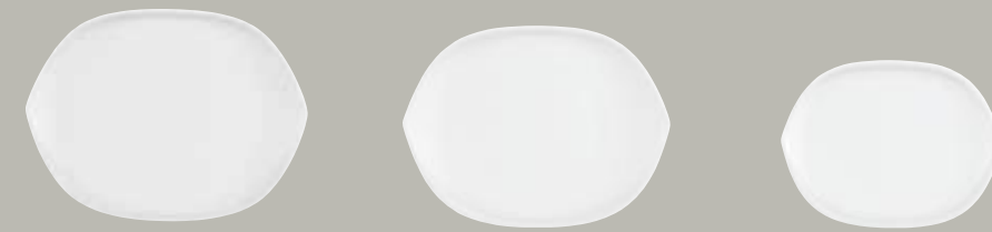
OCR-Nr. 16-4025-2820 Fl. plate hexag. - Ass. plate hexag. Tel. fl. sechseck. - Plat. llano hexag. 360 x 290 mm · 14 ¼ x 11 ¼ in. OCR-Nr. 16-4025-2780 Fl. plate hexag. - Ass. plate hexag. Tel. fl. sechseck. - Plat. llano hexag. - Piat. piano esago. 315 x 240 mm · 12 ¼ x 9 ½ in. OCR-Nr. 16-4025-2781 Fl. plate hexag. - Ass. plate hexag. Tel. fl. sechseck. - Plat. llano hexag. - Piat. piano esago. 255 x 195 mm · 10 x 7 ¾ in.

Hotel porcelain, dishwasher-safe, microwave-safe, salamander-safe - Porcelaine d'hôtel, garantie lave-vaisselle, four micro-ondes, salamandre - Hotelporzellan, spülmaschinenfest, mikrowellensicher, salamanderfest - Porcelana de hostelería, garantizada al lavavajillas, horno microondas, salamandra - Porcellana per alberghi, inalterabile in lavastoviglie, adatta per microonde e salamandre