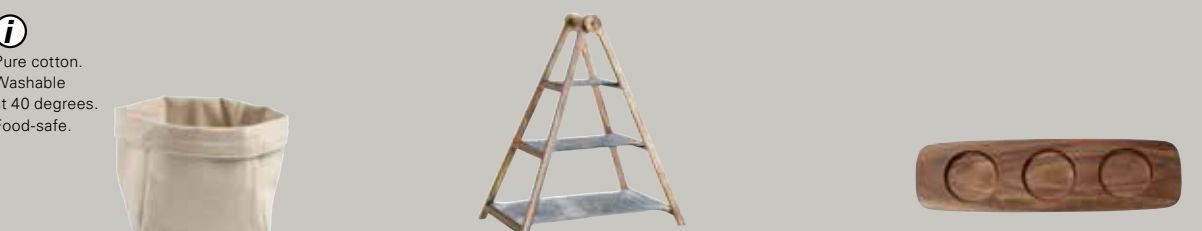
OCR-Nr. 16-4025-8053 Bread basket textile - Corbeille a pain textile Brorkorb Stoff - La cesta de pan textil Cestino del pane tessile 125 x 125 mm · 4 ¾ x 4 ¾ in. OCR-Nr. 10-4130-7990 Tray stand - Etagere - Etager - Centro aperitivos/frutero - Alzata portafrutta 490 x 410 x 255 mm · 19 ¼ x 16 ¼ x 10 in. (Oval bowl, Coupe ovale, Schale oval, Cazoleta ovalada, Coppetta ovale OCR-Nr. 16-4025-3577, -3580, -3844) OCR-Nr. 10-4130-8059 Tray Dip bowl - Plateau Coupelle Dip - Tablett Dipschälchen - Bandeja Cazoleta Dip - Vassoio Coppetta Dip 300 x 95 mm · 12 x 3 ¾ in. (Dip bowl, Coupelle Dip, Dipschälchen, Cazoleta Dip, Coppetta Dip OCR-Nr. 16-4025-3932)