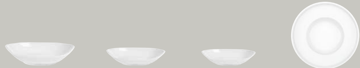
OCR-Nr. 16-4025-2670 Salad plate hexag. - Ass. Salad hexag. - Salattell. sechseck. - Plato Ensal. hexag. - Plat. Insala. esago. 310 x 240 mm · 12 ½ x 9 ½ in. OCR-Nr. 16-4025-2782 Deep plate hexag. - Ass. creuse hexag. - Teller tief sechseck. - Plato hondo hexag. - Piatto fondo esago. 260 x 200 mm · 10 ¼ x 8 in. OCR-Nr. 16-4025-1740 Deep bowl hexag. - Coupe cre. hexag. - Scha. tief sechseck. - Cop. honda hexag. - Cop. fondo esago. 215 x 140 mm · 8 ½ x 5 ½ in. OCR-Nr. 16-4025-2790 Deep plate - Assiette creuse Teller tief - Plato hondo - Piatto fondo. 300 mm · 12 in.